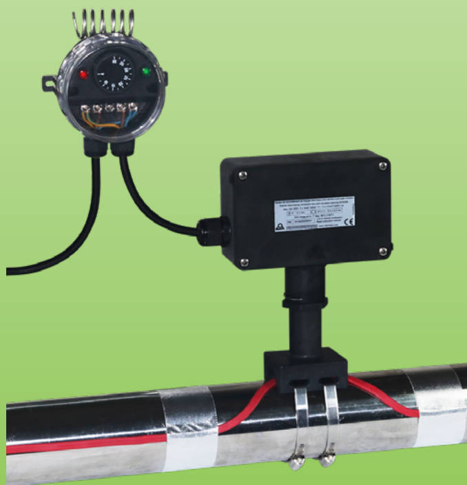
Beispiel für die Montage an 3 oder mehr Begleitheizungskabeln, in Kombination mit Y25 Anschlusskästen